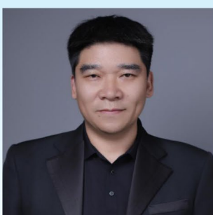
6329 喻学思 贰两花椒品质川菜馆