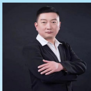
6326 安子林 盛德利安阳名菜馆