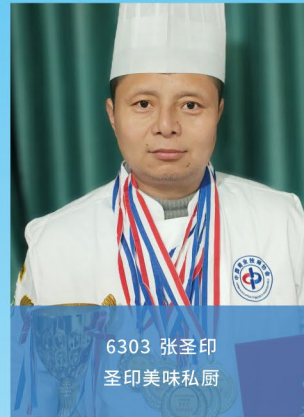
6303 张圣印 圣印美味私厨