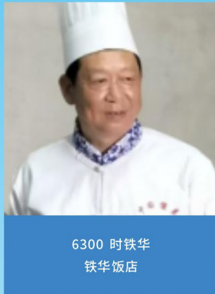
6300 时铁华 铁华饭店