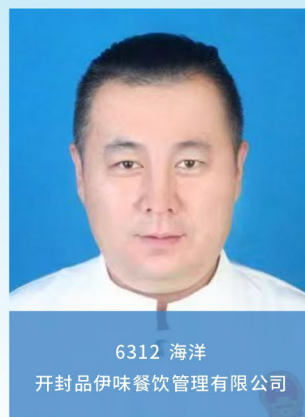
6312 海洋 开封市伊味餐饮管理有限公司