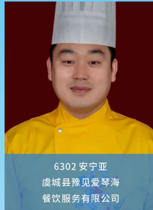
6302 安宁亚 虞城县豫见爱琴海 餐饮服务有限公司