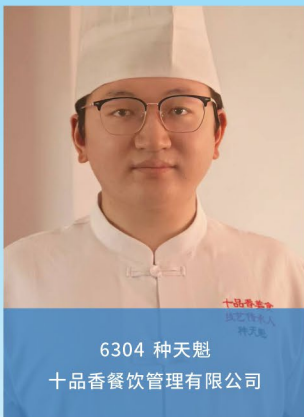
6304 种天魁 十品香餐饮管理有限公司