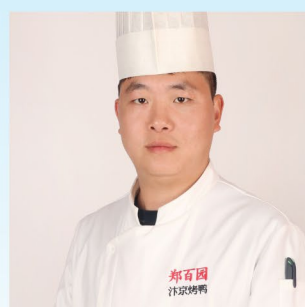
6332 唐新年 焦作郑百园餐饮有限公司